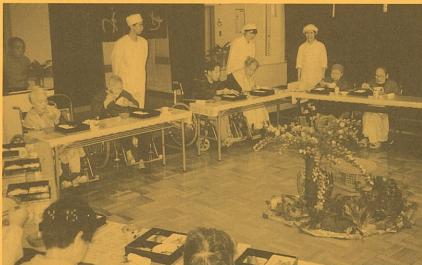
「四月のお楽しみ食事会」

桜の花も風に吹かれて散って行きます。時々私の病室に花びらが飛んで来る日もあります。毎日こうして見られる事だけでも幸せです。静岡県立