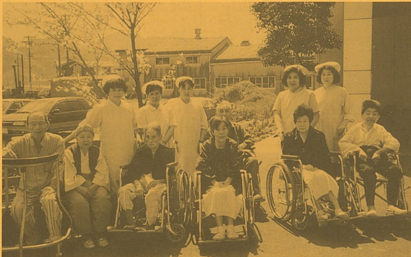
「春風にさそわれて」

なったら、この自然の恵みを、外に出て、患者さんと分かちたいものです。病院の裏のお地藏様も、患者さんの散歩を待っていて下さると思います。患者さんとお参りするたびに信心深かった母の姿を、私は求めているのかも知れません。 「ナースに要求されるのは、患者さんの不安に、きちんと向き合えて、支えていく人間性である。」この言葉をかみしめて、看護にたずさわっていきます。