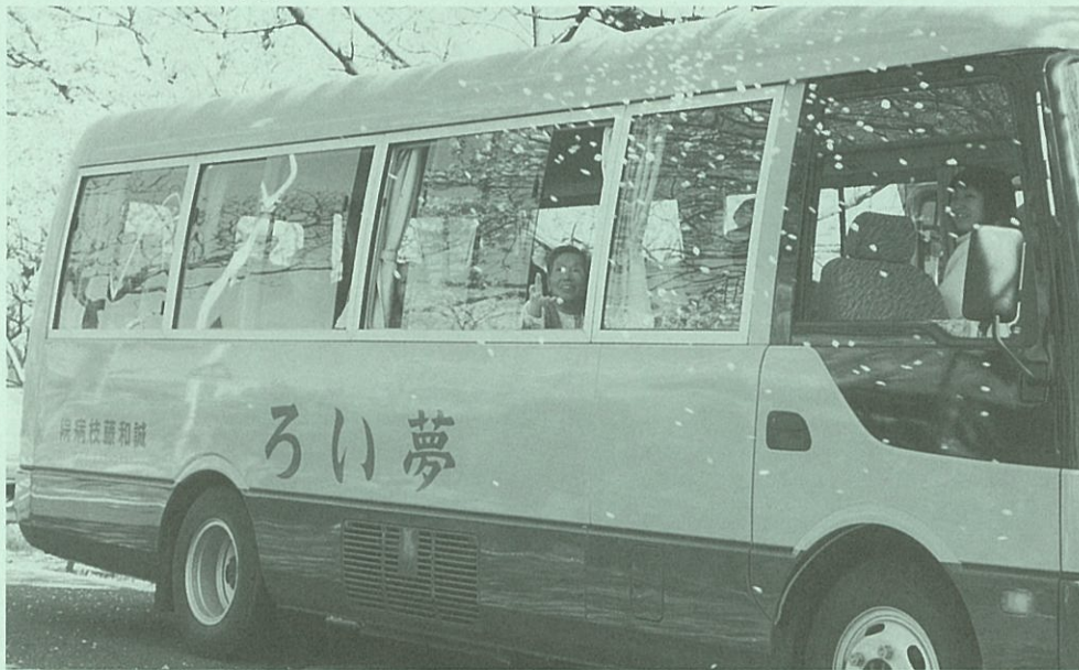
花吹雪を手にとってみたーい。

戦後、社会や文化は変化し多様化してまいりました。お年寄りを取り巻く環境には、未曾有の少子高齢化という問題に加え、お年寄り自身を含めた多くの人たちの価値観に、"ゆらぎ"がみられます。九十七年に成立した男女雇用均等法の精神は、嫁が家庭にこもり舅姑の世話をすることを奨励するものではありません。一方、急遽決められた家族への介護費支給は戦前の大家族制度での嫁の役割を依然として期待するものでしょう。しかし、病气や火事や強盗事件に巻き込まれた在宅老人の悲劇、痴呆老人を抱えた家族介護の実態といった、お年寄りの現状をみると、いまや孫に囲まれ相好を崩すおじいさんおばあさんといった、情緒的な介護風景を夢見る段階だけはすでに通り越しているでしょう。