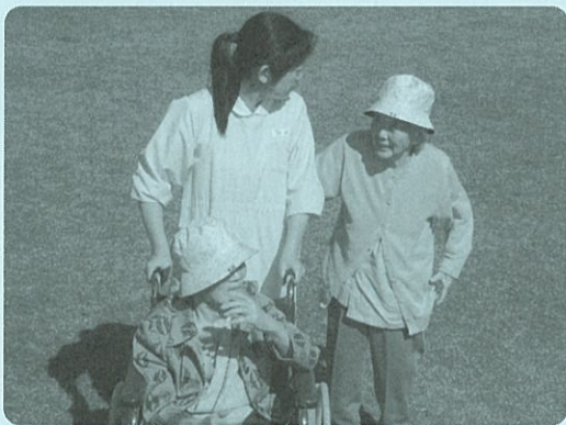
秋の遠足『清見田公園』

私たちの病棟の患者様は一日ベッド上で過ごされる方が何人かいらっしゃいます。できる限り車椅子に乗車していただき、天気の良い日には散歩に出掛け、周りの景色を楽しんでいただく