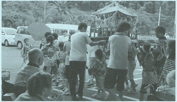
二宮神社祭典『子ども神輿』

で少し自分自身のことを付け加えさせていただきます。趣味は、パソコン（組立、修理）と健康のため歳相応の中高年スポーツ（ソフトバレーボール）です。他には、車を見ても判るように時々キャンプに出かけたり、冬はスキーをすることです。基本的には半日しか勤務していないようなものですが、何かありましたら気軽に声をかけていただきたいと思います。スタッフとして十分働けるようがんばりますので、よろしく願います。