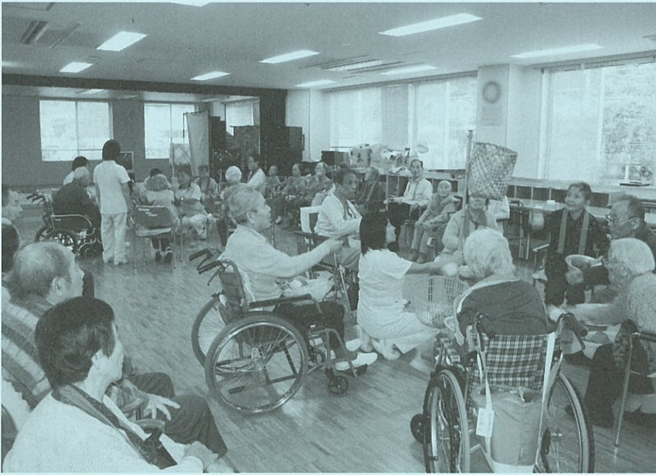
秋の運動会『玉入れ』