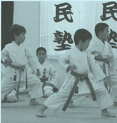
納 涼 祭 『空手披露』

今は社会人として『責任』という面でこれまでとは大きな違いを感じていますが、良き先輩達にも恵まれ日々楽しく仕事をしています。理学療法士として、病院の職員として学ぶことは多々ありますが、精一杯頑張りたいと思っていますので、よろしく願います。