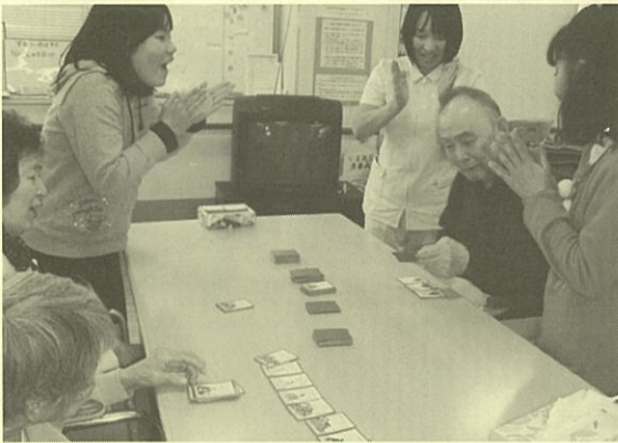
西北小学校との交流会 かるた遊び