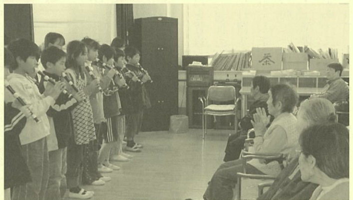
西北小学校との交流会 リコーダーの演奏

病んでいる人に真心こもる奉仕」というものを受け、今年度の看護部の目標を「優しく手の届いたケアの実践」としています。制度上の変化の問題について勉強しつつ、現場では、患者様・御家族様へ安心感を与えられるような言葉かけ・態度・実践を心がけていきたいと思えます。