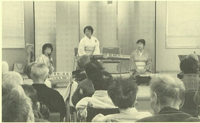
「ころりん」による琴の演奏会

からないまま過ぎてしまっています。仕事を覚えて、楽しく明るく仕事をし、早くこの環境に慣れていきたいと思っています。 通所を利用していらっしゃる皆様を送迎をお手伝いさせて頂くこともあるので、色々勉強をしていきたいと思っております。一生懸命頑張りますので、よろしくお願ひします。