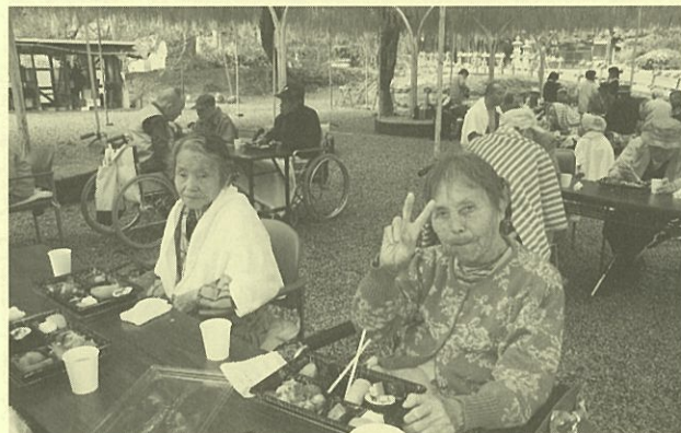
屋外機能訓練「外だと食事が進むね」

るパワーを発揮してくれることを願いつつ、中堅・ベテランの職員もそれに負けないよう、職員一同、一丸となって頑張っていけたらと思います。