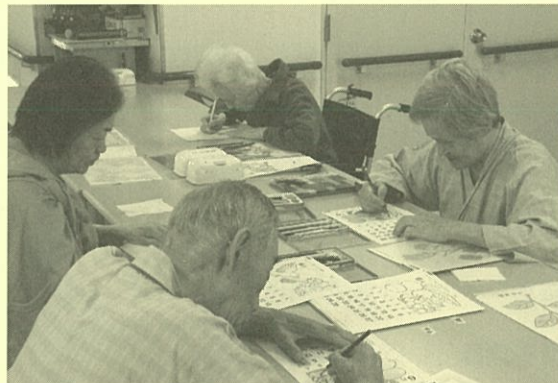
ホールでの塗り絵風景

重症の患者様、気管切開、経管栄養などで多くの介助が必要な患者様も入院されています。私たちは少しでも楽しい時間を過ごしていただけるよう、塗り絵、カレンダー作り等を取り入れています。患者様の入院生活が、安全で快適なものになるよう、又、御家族様や患者様から「ありがとう」と言ってもらえるよう、スタッフで協力し合い、努力して参ります。